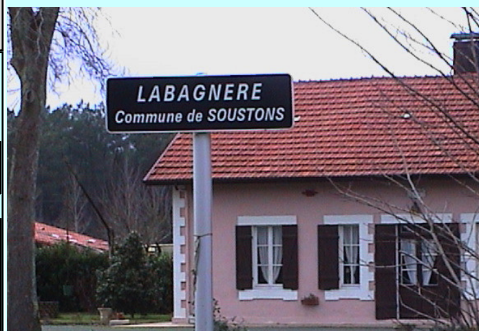
La Bagnère, panneau de quartier

On peut consulter la Grande note : LA BAGNÈRE, TOPONYME SOUSTONNAIS. Nous en donnons ici un abrégé.